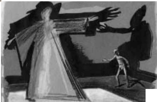
© Dessin de Damien Caille-Perret, scénographe et créateur des costumes du spectacle

Après Onclé Vania , événement marquant de la saison dernière, Yves Beaunesne, artiste associé à la Scène nationale, met en scène Conversation chez les Stein sur Monsieur de Goethe absent , pièce peu connue de l'auteur allemand Peter Hacks.