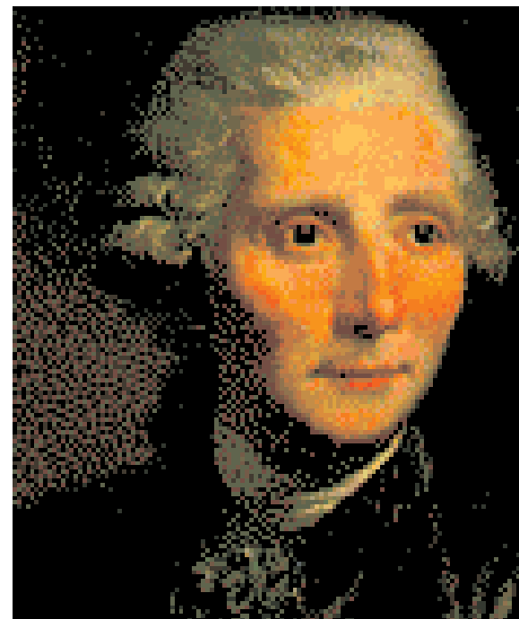
Né à Paris le 24 janvier 1732 Mort à Paris le 18 mai 1799.

VOLTAIRE À D'ALEMBERT, À PROPOS DE BEAUMARCHAIS ET DE SON QUATRIÈME MÉMOIRE CONTRE GOËZMAN, RÉDIGÉ EN 1774.